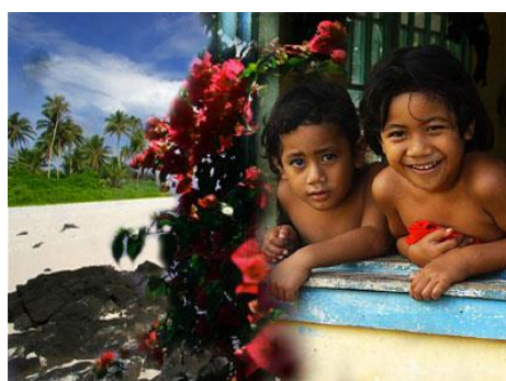
小孩笑靨的溫度：實際上，薩摩亞識字率高達 99.7%。

或許這與接下來要討論的議題不直接產生學術論述上的關聯，但是我在處理議題時所抱持的基礎態度，雖然這一份任務規劃將不會實際參與評選，我期待自己仍然透過寫作的過程中整理，或者拉扯出一些未來有機會可以實地訪查的題目，作為一種「練習」，同時也是對於向他者學習的「圖像」，我希望呈現出的是一個有故事性和畫面感的題目，期待研究本身的溫度，而這份「溫度」，其實也是源自於我對於大洋洲民族誌本身的感受，我認為太平洋島嶼的人群有一種對於情感散發的高度能力或者說是能量，這是我每每在學習時會感受到的特殊之處。